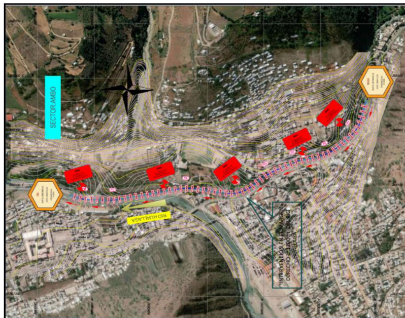
5.- IMAGEN SATELITAL DE ZONA VULNERABLE